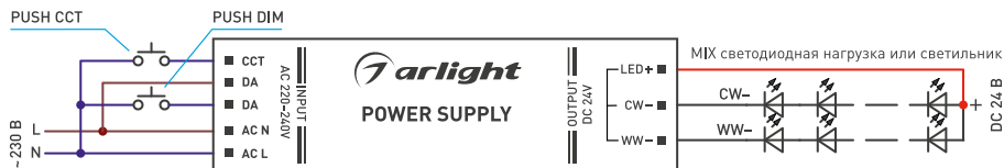
Рис. 2. Пример подключения функции PUSH DIM, PUSH CCT

Для блоков питания, не имеющих отдельного выхода CCT реализация функции PUSH CCT выполняется применением ограничивающего диода типа 1N4004 (см. рис. 3).