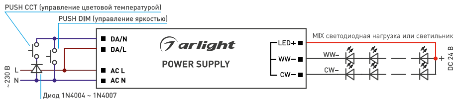
Рис. 3. Пример подключения функции PUSH DIM, PUSH CCT без выхода CCT на источнике питания* (*Подключение функций PUSH DIM, PUSH CCT для артикулов 047031 и 048241).